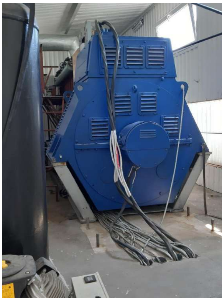
Технологічна лінія з дегазації полігону твердих побутових відходів м. Кам'янець-Подільський