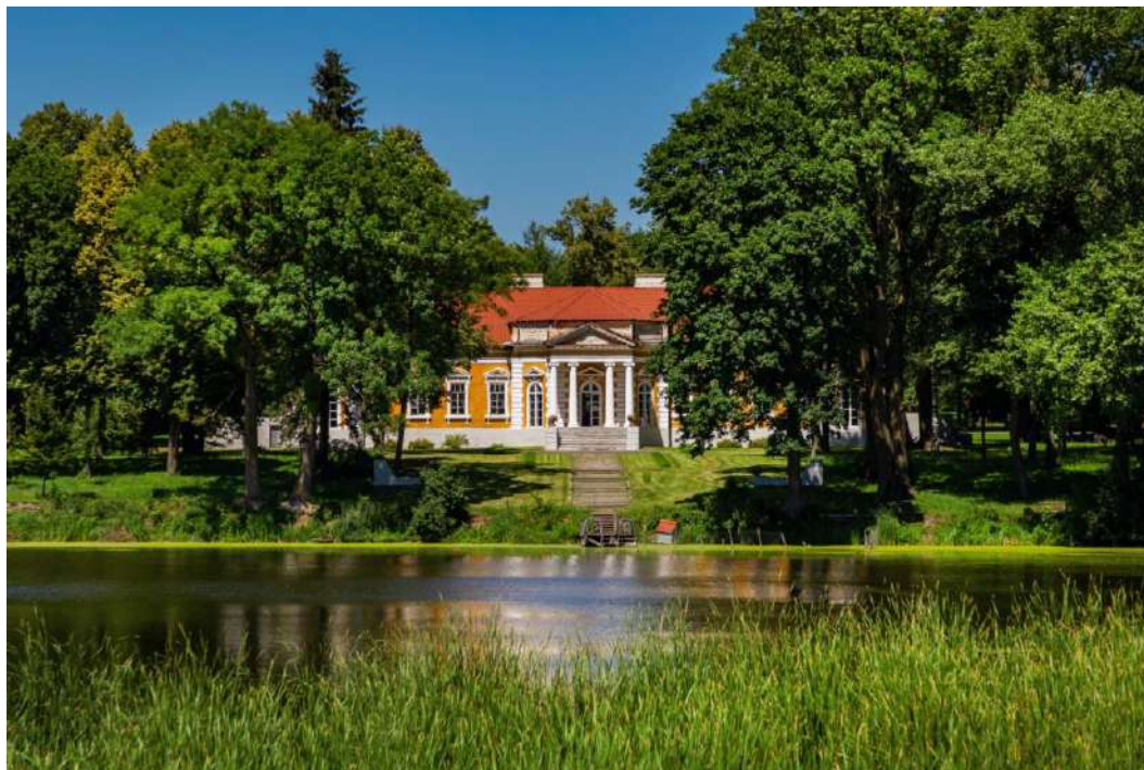
Парк-пам'ятка садово-паркового мистецтва загальнодержавного значення «Самчиківський парк»