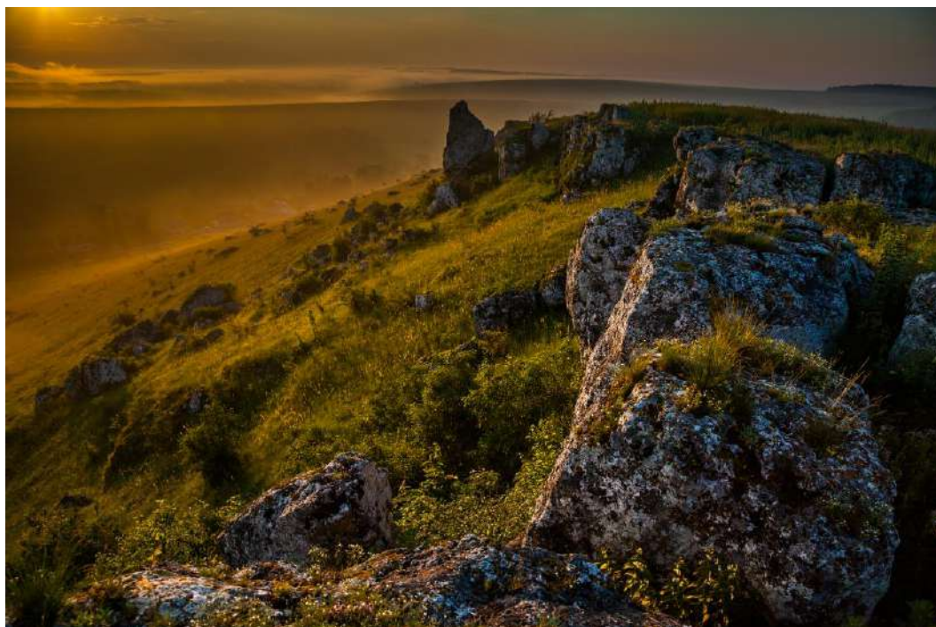
Ландшафтний заказник загальнодержавного значення «Івахновецький»