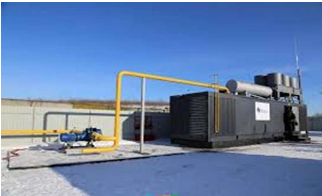
Когенераційна установка з дегазації полігону твердих побутових відходів у м. Хмельницькому