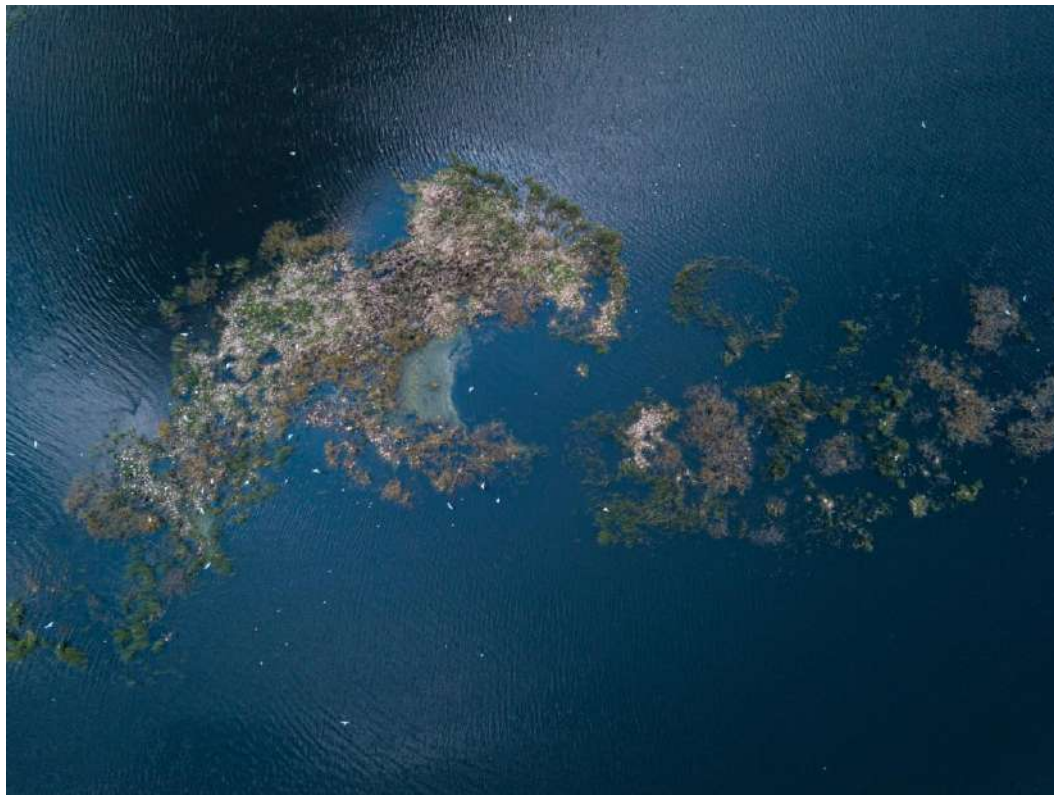
Гідрологічний заказник місцевого значення «Юхимовецький»