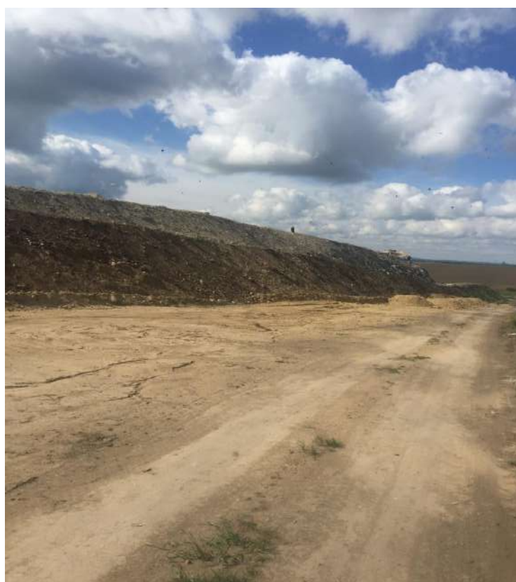
Полігон твердих побутових відходів у м. Старокостянтинові